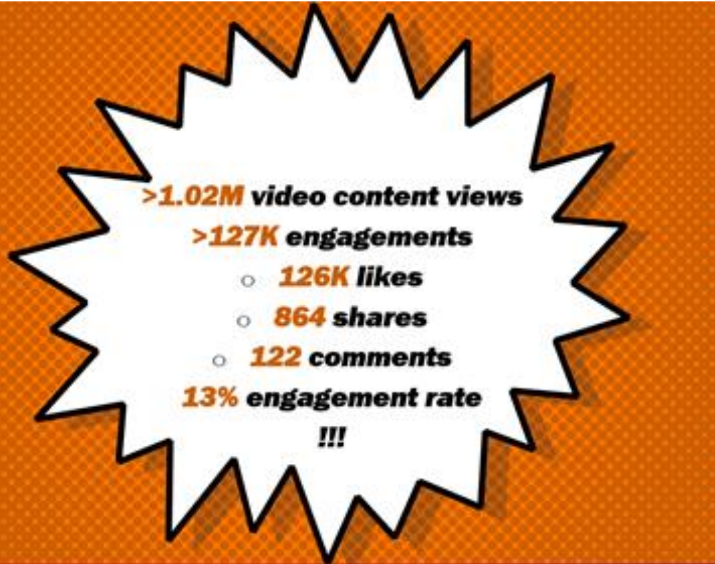
Tik Tokers content metrics.